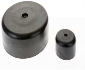
Support antivibratoire machine agroalimentaire